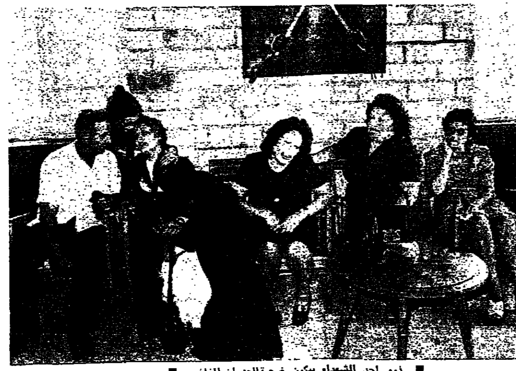
زوج احد الشهداء بيكرن قسبة العموان الغلشم